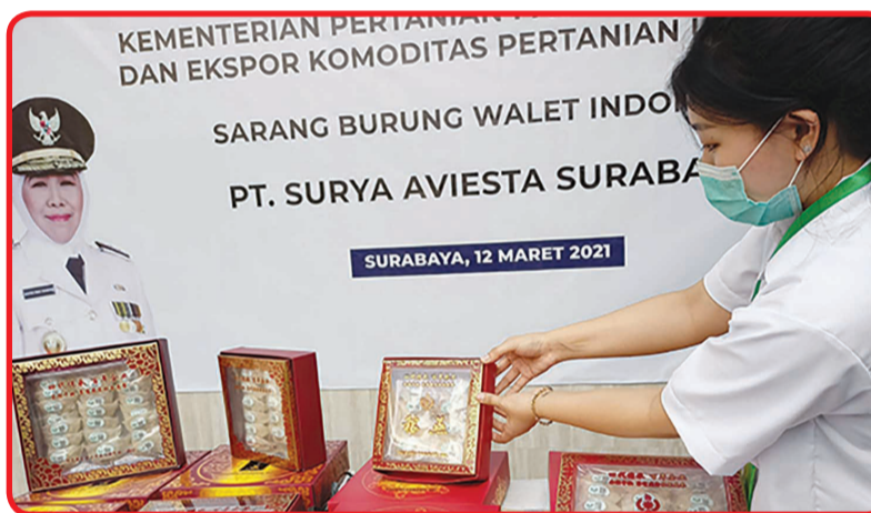
Produk sarang walet yang diekspor.