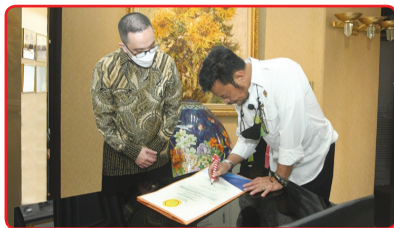
Mentan menandatangani penghargaan.

Mentan memastikan pemerintah siap mendukung PT Surya Aviasta dan seluruh produsen sarang burung walet di berbagai daerah untuk berkembang lebih besar terutama dalam memenuhi permintaan dari berbagai negara selain Tiongkok. "Selama ini kita masih menguasai pangsa pasar