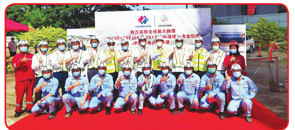
FOTO BERSAMA: Staf pekerja yang berpartisipasi dalam upacara penyambungan Continuous Beam DK20 + 156 berfoto bersama.

jembatan cable-stayed Grand Wisata yang melintang di atas akses ramp Jalan Tol Jakarta-Gikampek. Hanging basket konstruksi berjarak kurang dari 1 meter dari kabel baja terdekat dari jembatan tersebut. Kondisi sekitarnya rumit dengan tingkat resiko keamanan tinggi.