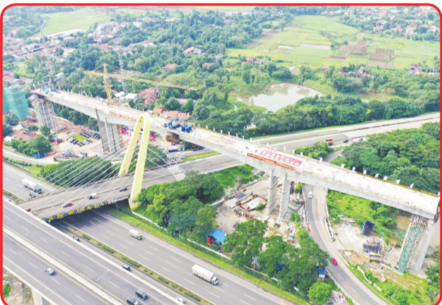
Continuous Beam DK20 + 156 telah tersambung dengan sukses.

Selama epidemi, mengambil langkah tegas untuk memastikan keamanan pencegahan epidemi sambil mencatat rekor tinggi menyelesaikan sepagas segmen dalam 10 hari. • idn/din