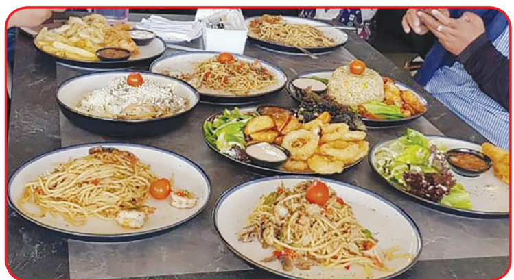
Berbagai menu yang ada di O!Fish.