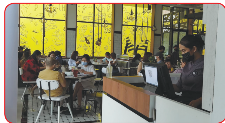
Suasana di resto.

Kini, O! Fish telah resmi dibuka, selain mudah dijangkau resto ini, cocok untuk milenial hang out dan keluarga disaat waktu yang senggang. • bam