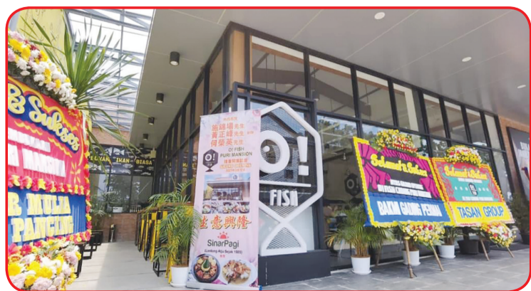
O!Fish Puri Mansion.