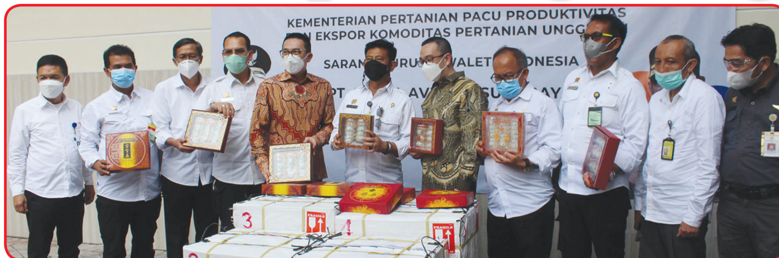
Mentan menunjukkan produksi sarang walet PT Surya Aviasta.

Kemudian berkeliling pabrik melihat langsung proses produksi dan hasil sarang burung walet yang siap diekspor. Mentan Syahrul Yasin Limpo mengatakan produk